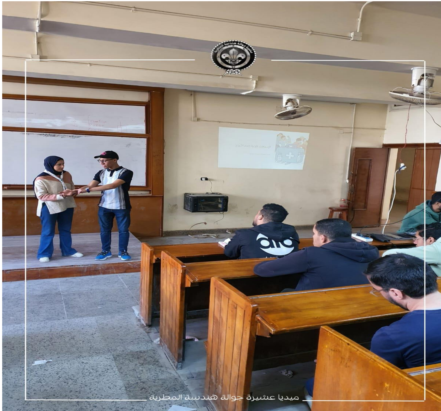
ميديا عشيرة جولة هندسة المطرية