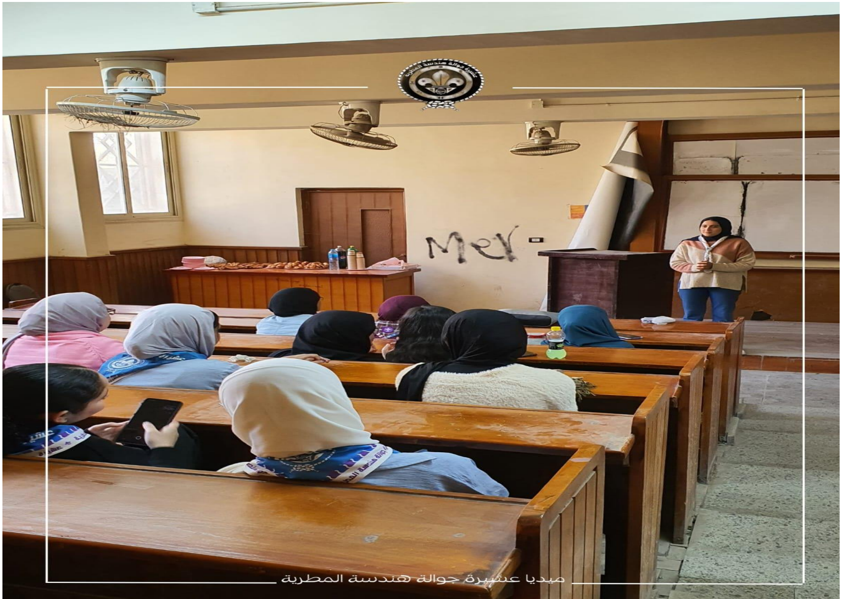
ميديا عشيرة جواله هندسة المطربة