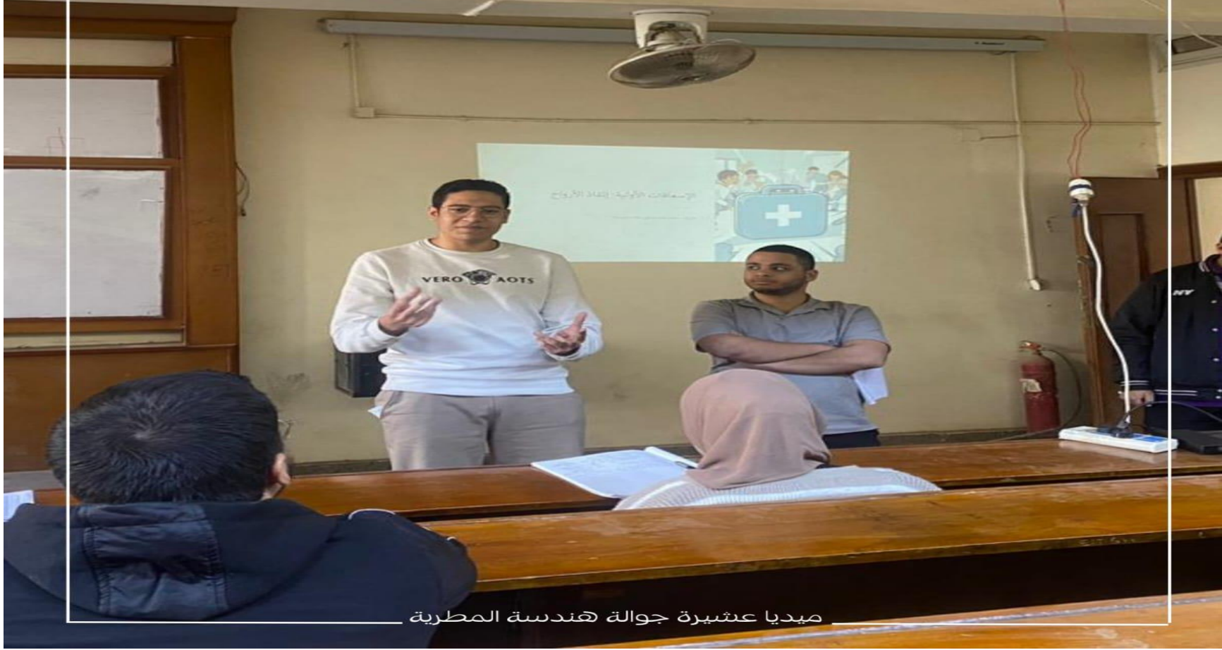
ميديا عنشيرة جواله هندسة المطرية